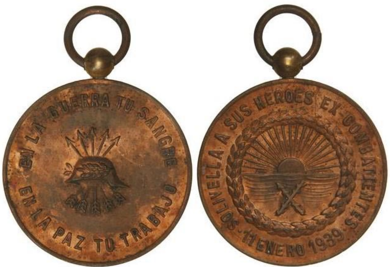
Foto 32 / Anvers i revers de la medalla commemorativa als ex combatents solivellencs.