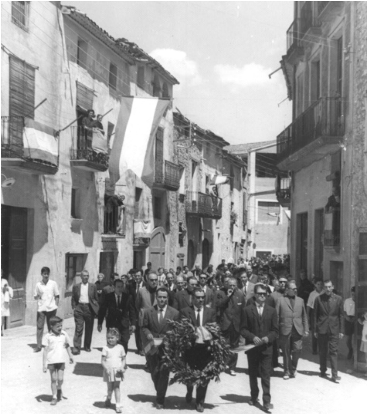
Foto 12 / Comitativa dirigint-se al “monument”.