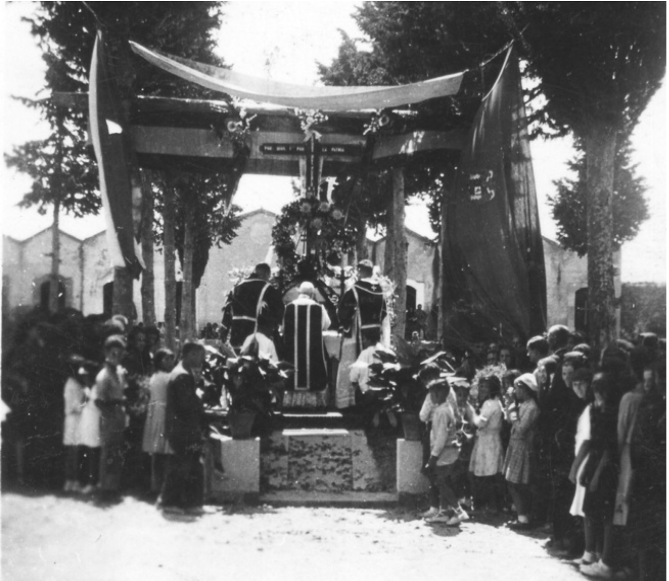
Foto 28 / Inauguració del panteó l'any 1941, sense la làpida amb els noms dels enterrats que hi fou col·locada el 12 de febrer de 1942.