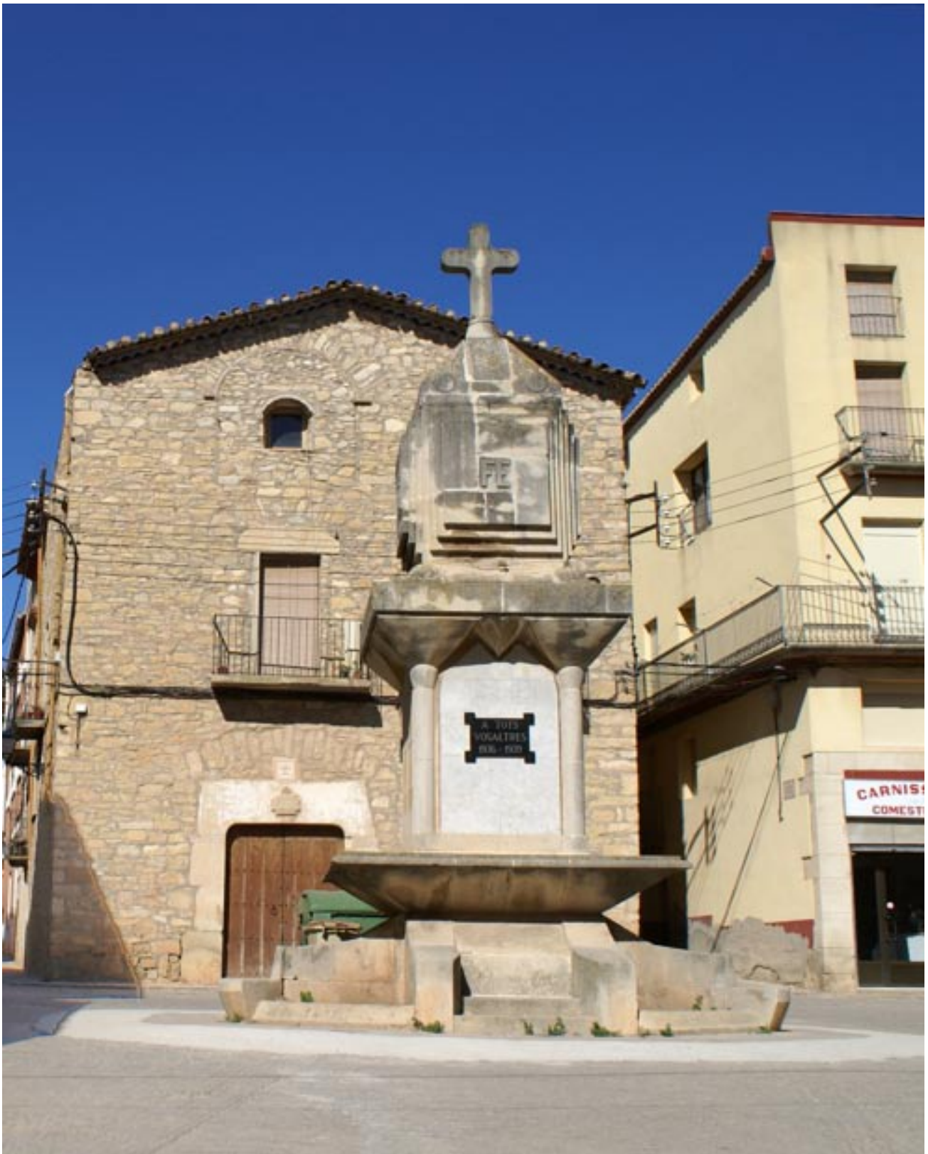
Foto 3 / El Monument abans del darrer condicionament. Agost de 2010.