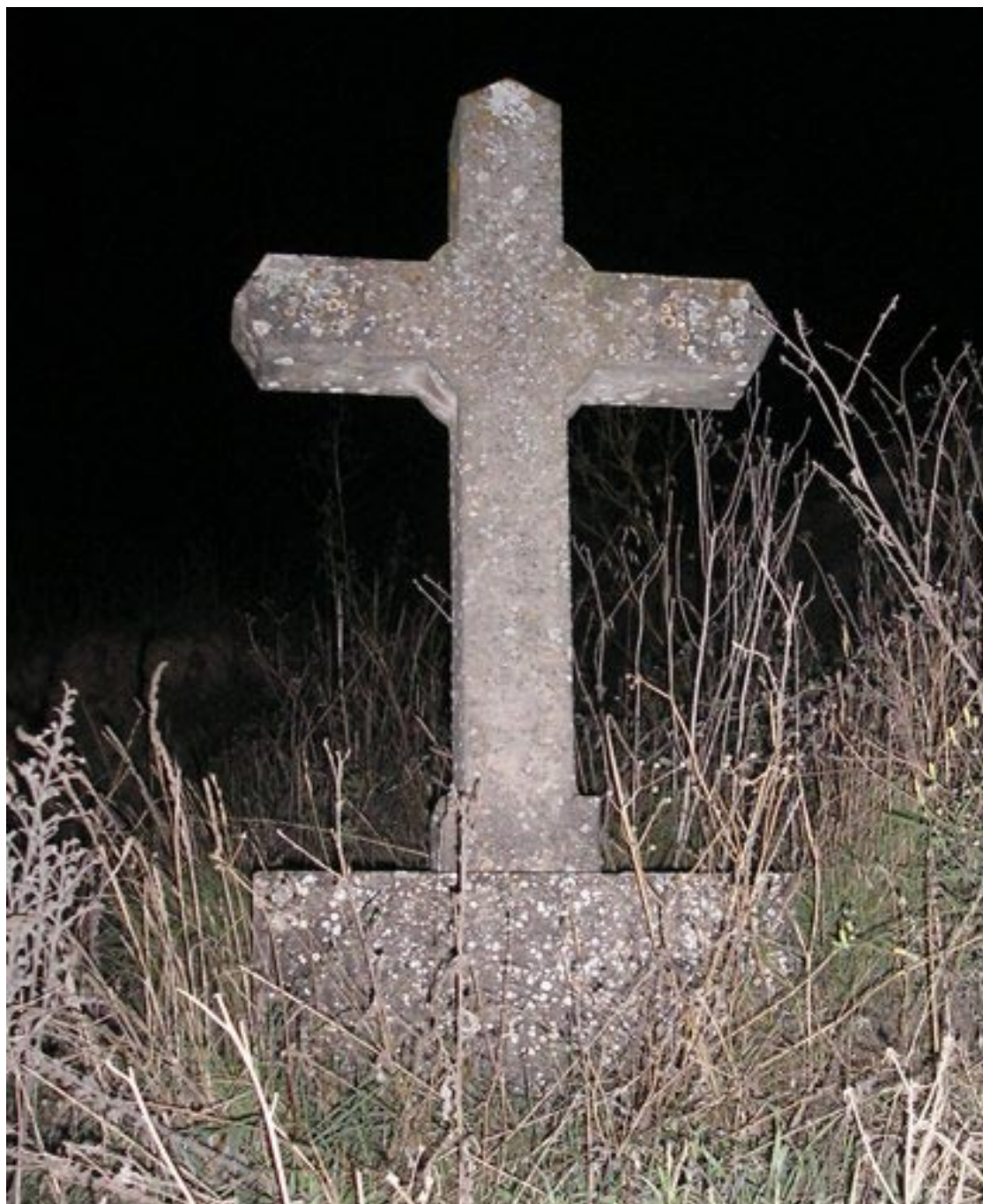
Foto 22 / Creu-recordatori dedicada a mossèn Jaume Sanromà, assassinat el 24 de juliol de 1936, abans de ser destruïda el 7 d'octubre de 2006.