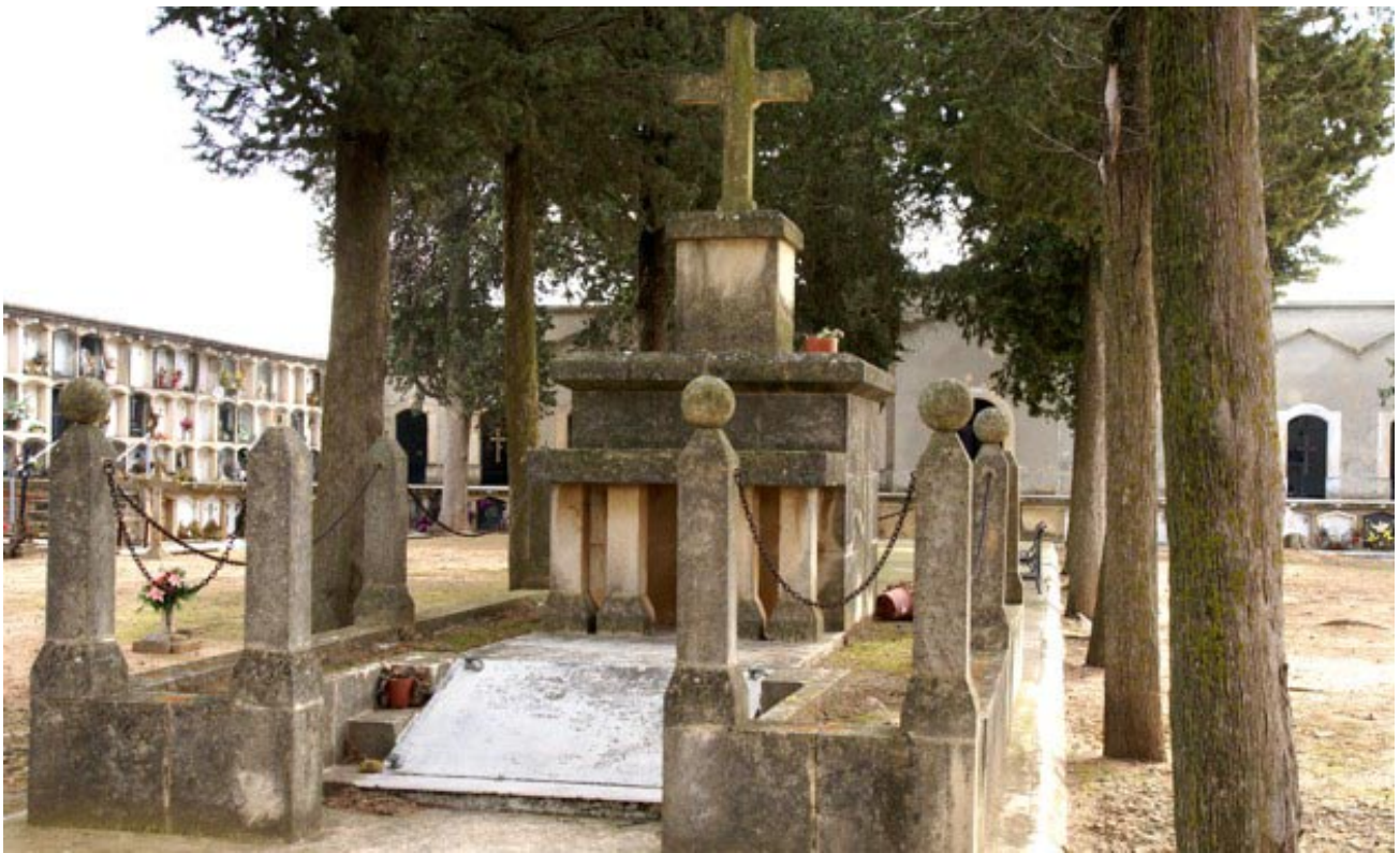
Foto 27 / El panteó del cementiri en l'actualitat.