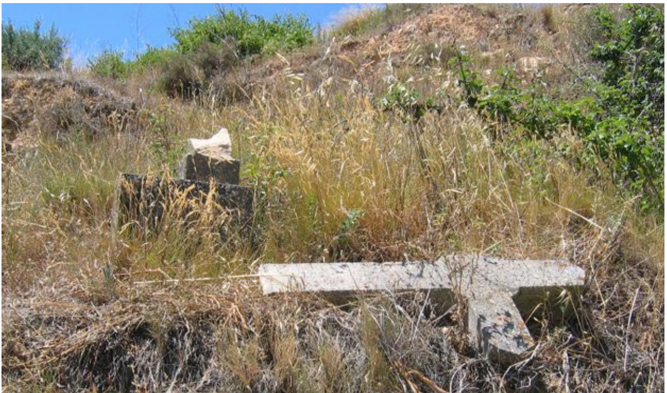
Foto 23 / Estat de la creu actualment, després de l'acte vandàlic del 7 d'octubre de 2006.