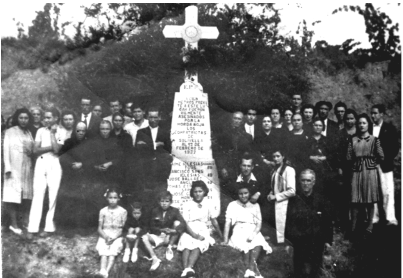
Foto 18 / Familiars dels assassinats el 12 de febrer de 1937, en motiu de la inauguració de la creu erigida en el seu honor a la carretera de Sarral a Pira. 13 de febrer de 1939.