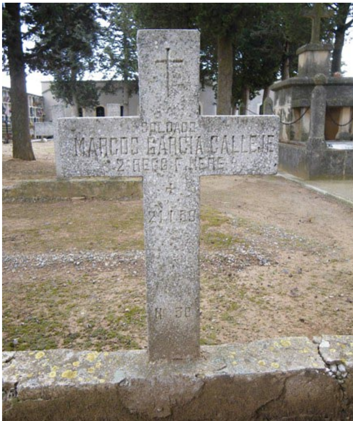
Foto 7 / Creu que designa l'enterrament al cementiri de Solivella del soldat espanyol, integrant de la divisió italiana dels Frece Nere.