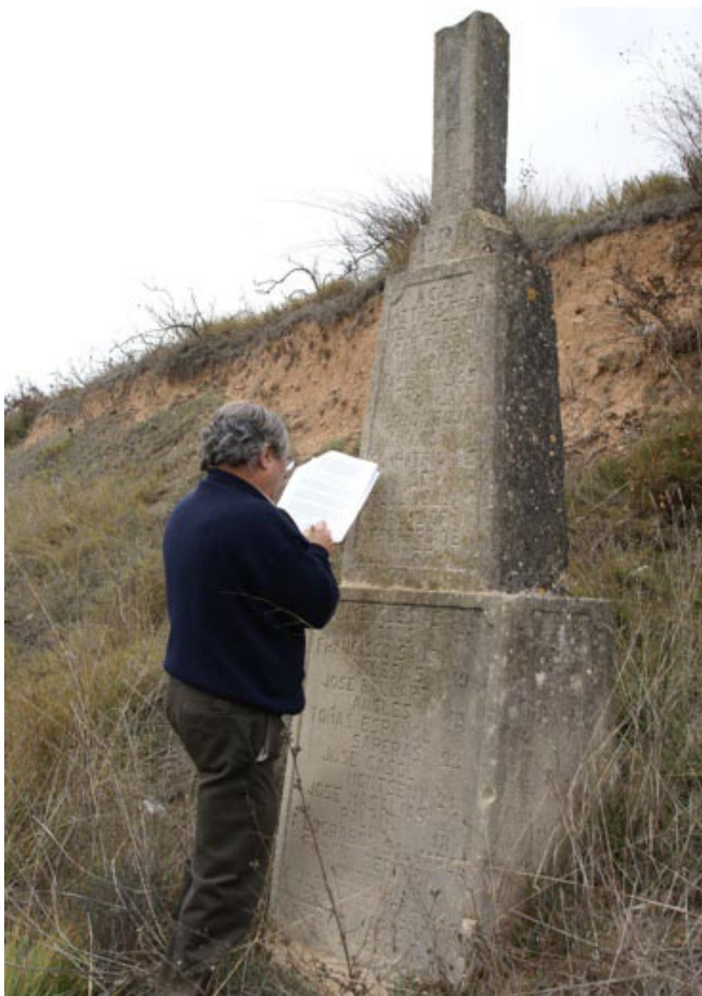
Foto 26 / Creu commemorativa, actualment mutilada, dels assassinats a Sarral el 12 de febrer de 1937.