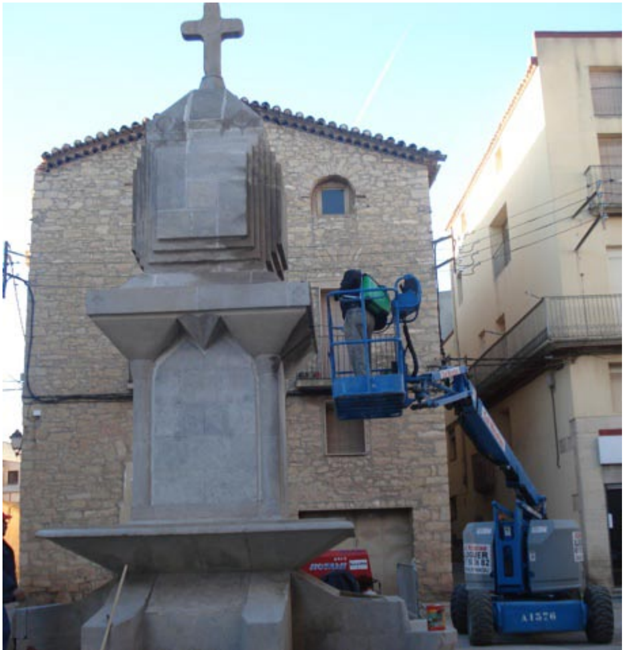
Foto 4 / Obres de condicionament del “monument” el 20 de desembre de 2010