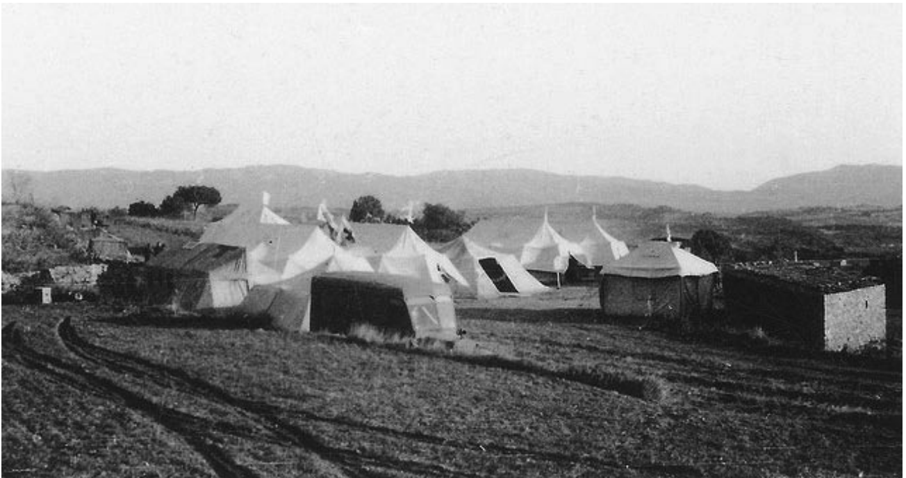
Foto 6 / Hospital de camp de la divisió italiana als afores de Solivella (15 de gener de 1939).