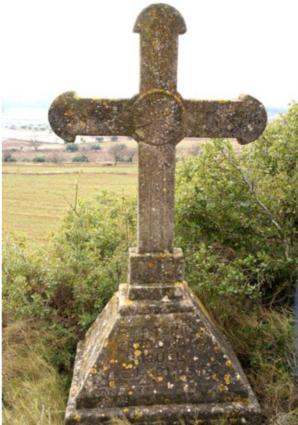
Foto 24 / Creu-recordatori de l'assassinat de mossèn Tomàs Capdevila i Miquel, rector de Conesa, assassinat davant del cementiri de Solivella el 6 de setembre de 1936.