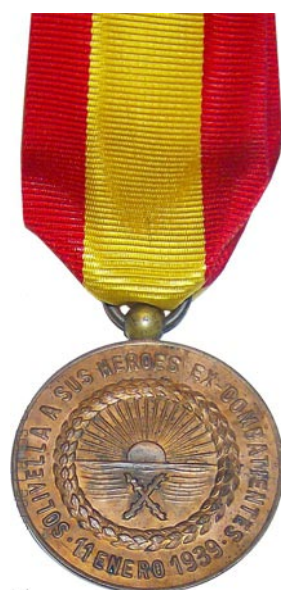
Foto 31 / Medalla commemorativa als ex combatents solivellencs.