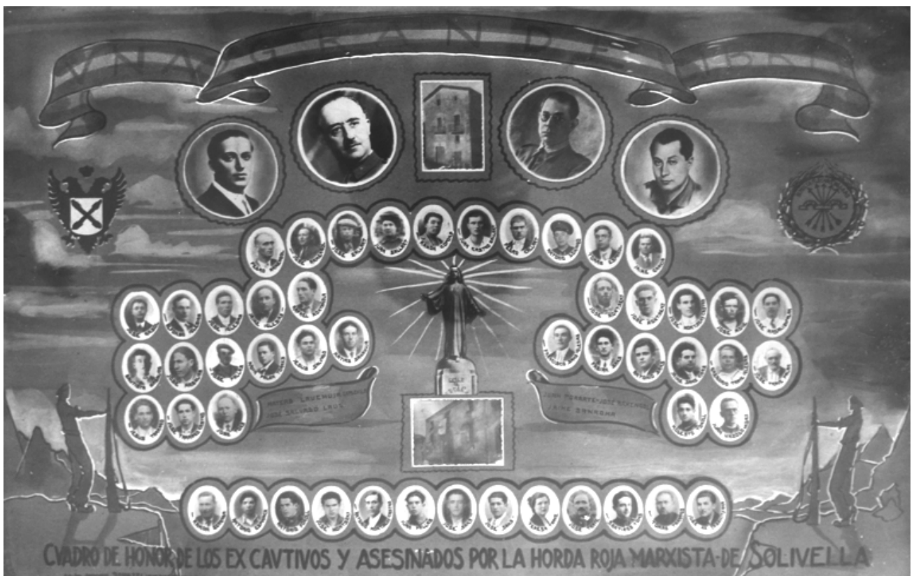
Foto 17 / "Cuadro de Honor de los excautivos y asesinados por la horda roja marxista de Solivella"