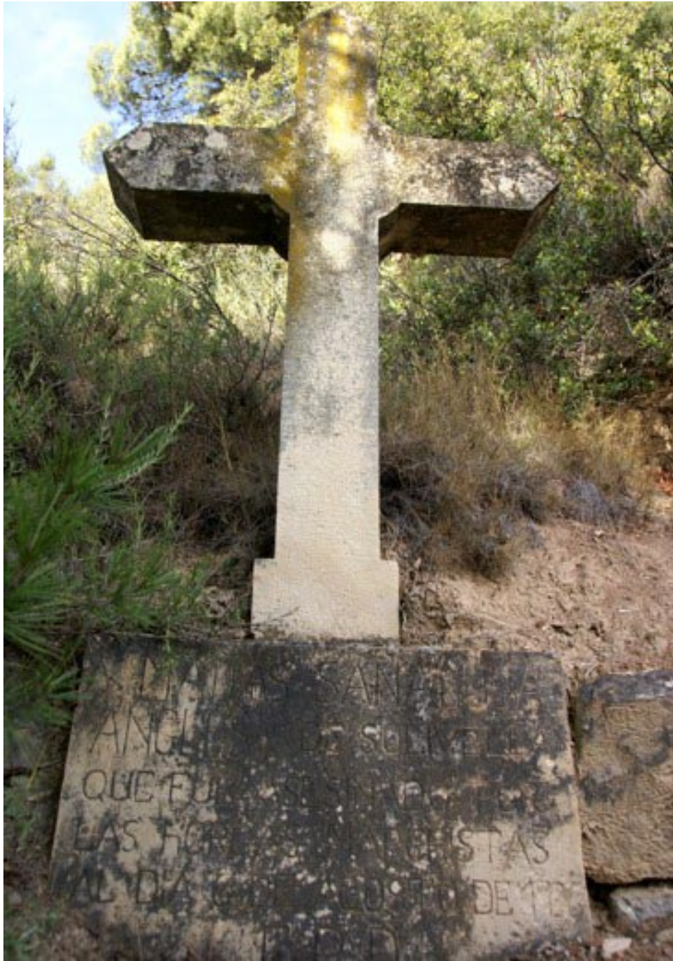
Foto 9 / El lloc on fou assassinat el 6 d'agost de 1936 Maties Sanahuja Anglès. Carretera de Vallbona a Rocallaura.