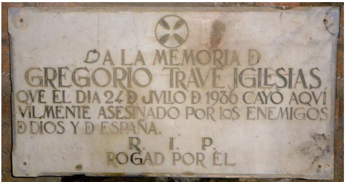
Foto 20 / Làpida-recordatori de l'assassinat de Gregori Travé Iglesias, que fou colocada a la pared de l'entrada a l'hostal.