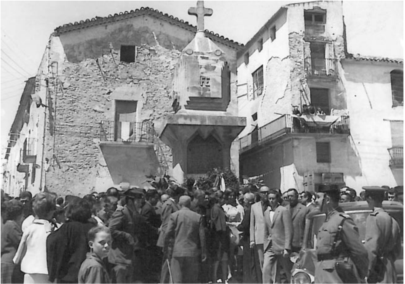
Foto 14 / Honors al “monument” en motiu de fer “fill adoptiu” del poble al Dr. Francesc Tapias (any 1966).