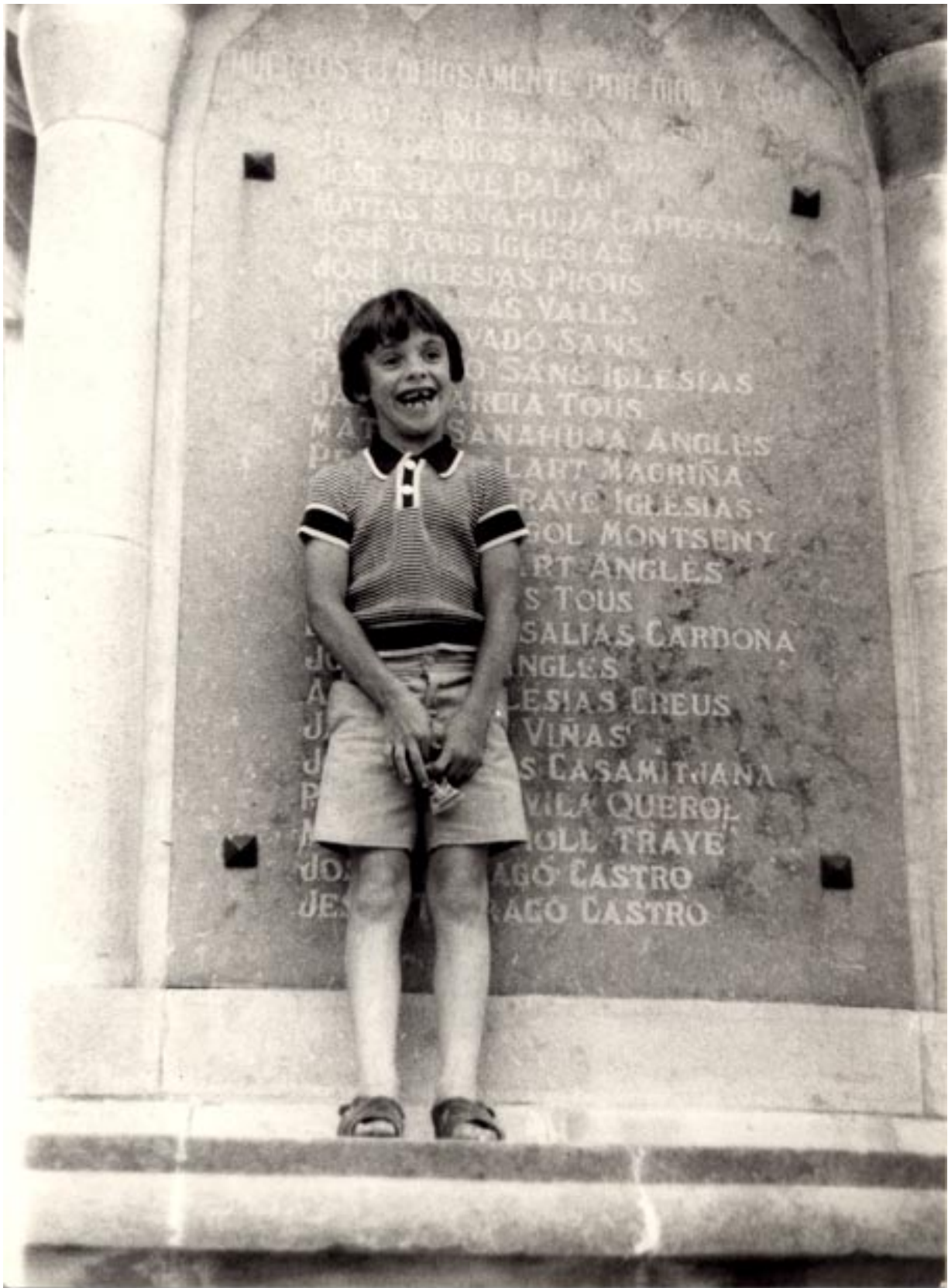
Foto 2 / Es veuen una part dels noms de la relació dels assassinats de dretes (vers 1975).