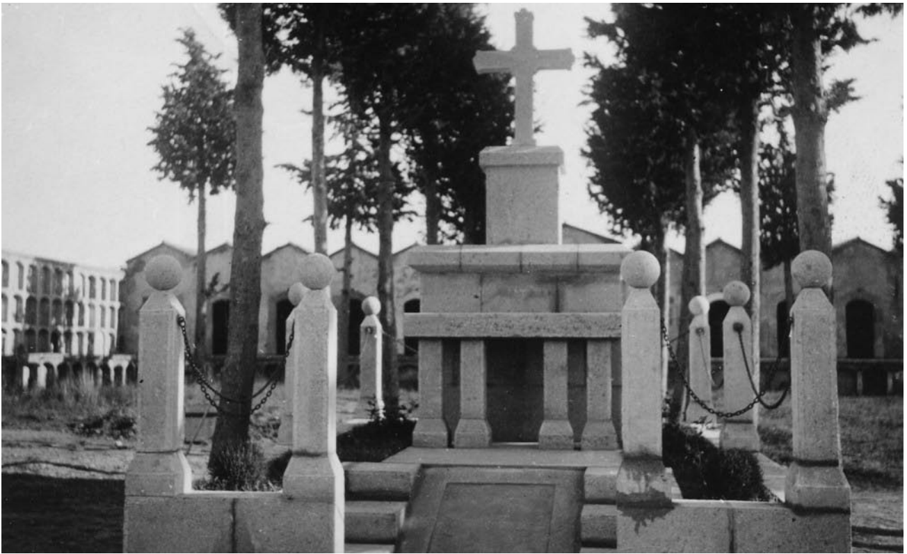
Foto 29 / El panteó, preparat per la seva inauguració, l'any 1941.