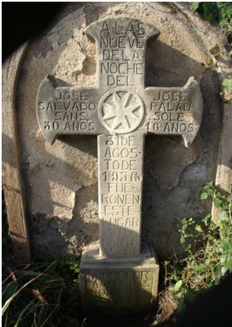
Foto 25 / Creu-recordatori de Josep Salvadó Sans i Josep Palau Solé, assassinats el 31 d'agost de 1936, erigida a l'antiga carretera d'Alcover a Reus.