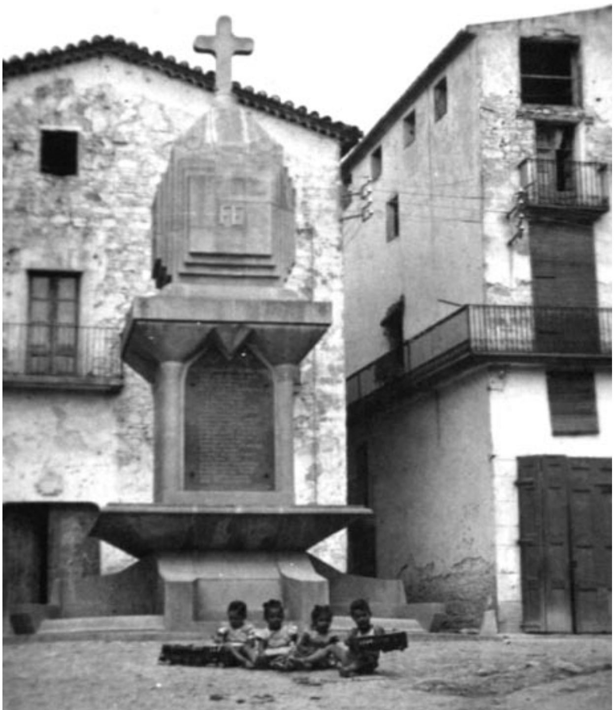
Foto 1 / Aspecte del monument a començaments dels anys cinquanta del segle XX