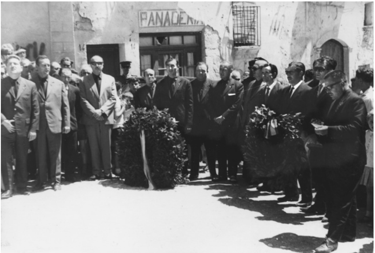
Foto 13 / Honors franquistes al monument. (Fotografia cedida per Jordi Travé)