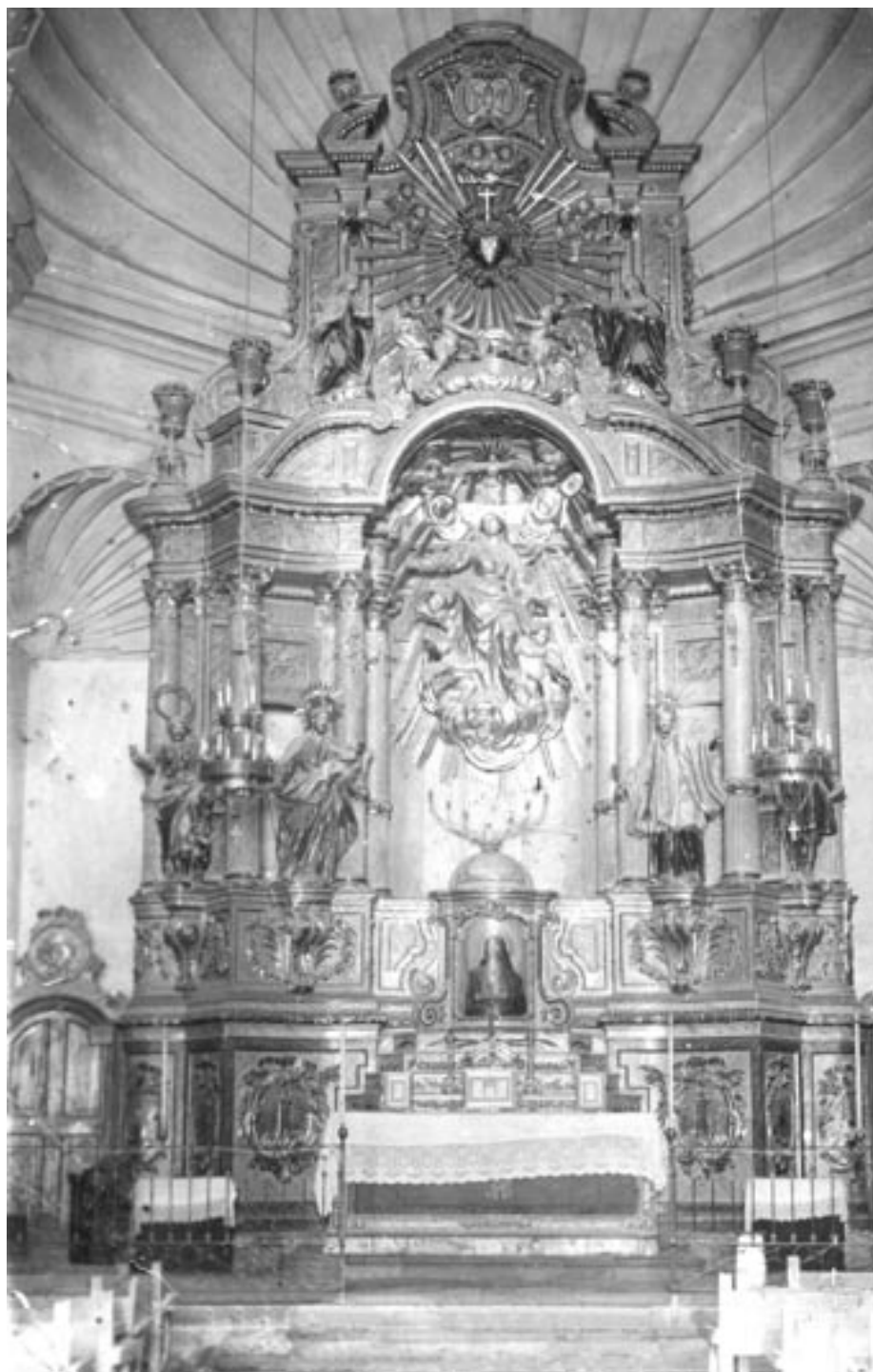
Foto 11 / Altar barroc que presidia l'altar major de l'església parroquial de Solivella, de Francesc Bonifàs i Massò, desmantellat i cremat, amb altres altars, a final de juliol de 1936