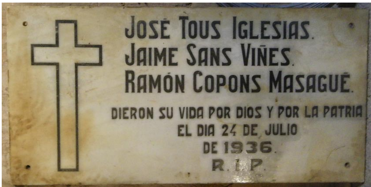
Foto 33 / Aquesta placa de marbre es trobava a la paret del magatzem de cal salat. Actualment la té la Rosita Copons.